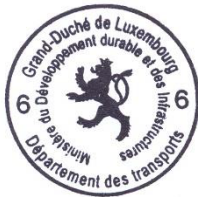
Marco FELTES Inspecteur Principal 1 er en rang

Pour le Ministre du Développement durable et des Infrastructures